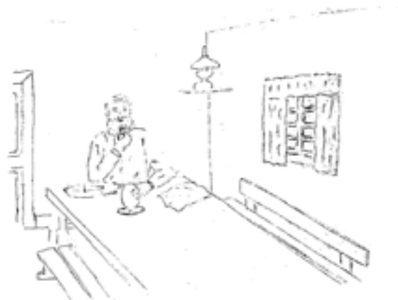
Morgenbarbering henad middagstide